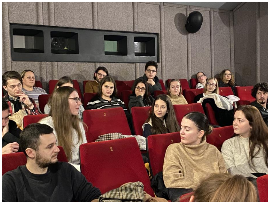
Vlaamse filmavond in de bioscoop Apolló in Debrecen

Deze cursus was een groot succes. Wij allemaal leerden iets nieuws. Wie weet, misschien kunnen we op een gegeven moment de naam van één van onze studenten aan het eind van een buitenlandse film zien als vertaler. Wij, docenten, hopen alvast dit project te kunnen voortzetten met nog nieuwe cursussen in één van onze landen.