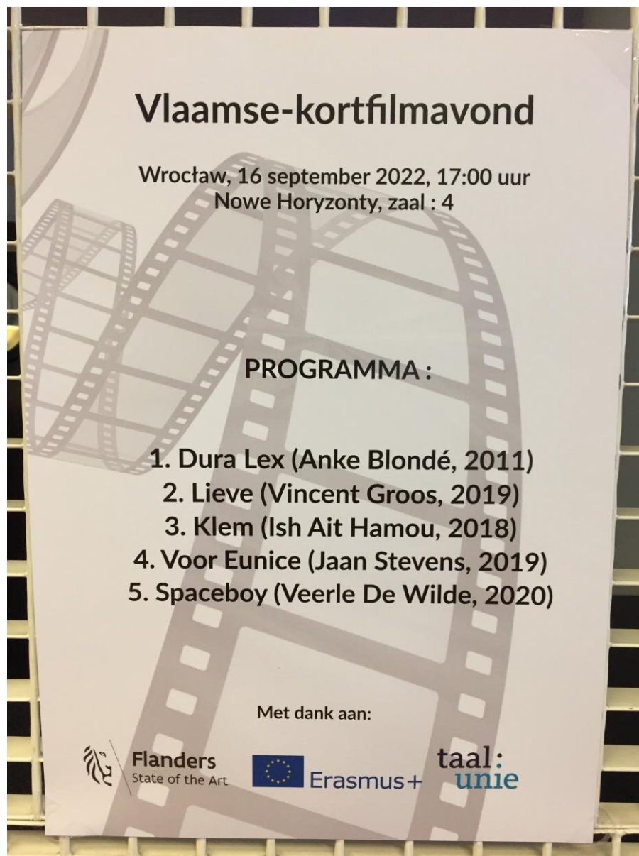
Affiche van de Vlaamse kortfilmavond in Wrocław